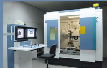
Internal control machine of aluminium structure with X-rays Röntgenstrahl, für die Qualitätskontrolle der Kristallstruktur von Aluminiumteilen