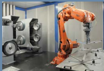
Sharpening - Polishing with the use of robotics Schliff - Polieren mit Robotern