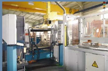
Aluminium die-casting Aluminium Druckgussfertigung