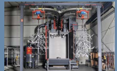
Surface processing with shot blasting Aluminium Flächenbehandlungsanlage